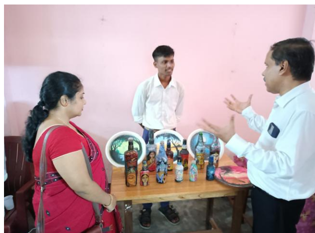
Few Snapshots of the Event