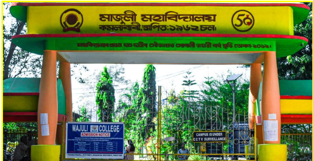
Main Gate of the College